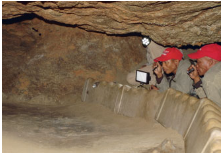
Beide /Uis bei der Arbeit: Sie lesen die Fußabdrücke unmittelbar vor ihnen und erkennen darin die Spuren eines 12-jährigen Mädchens.

schung halten sie sich streng nur an belegbare Fakten und unterlassen alle Spekulationen. So machten sie immer Angaben zu Geschlecht und Alter der Personen, deren Spuren sie lesen konnten, wo Unklarheiten blieben, wurden keine Aussagen getroffen. Und damit gibt es doch eine Änderung, welche die gesamte Prähistorie betrifft: Wer von jetzt an über die eiszeitlichen Spuren arbeitet, kommt an den Feststellungen der San nicht mehr vorbei. Ob sie die endgültige Wahrheit darstellen oder nicht, sei dahingestellt, aber noch nie wurden diese Spuren von derart sachkundigen Experten untersucht und deren Gutachten ist das kompetenteste, das je erstellt wurde. Spekulationen über rituelle Tänze, Initiationsriten und dergleichen wird man von nun an nicht mehr leichthin in die Welt setzen können, denn so trocken und ernsthaft wie die Fährtenleser an ihre Arbeit gingen, so waren auch die aus den Spuren zu lesenden Handlungen: Man ging offenbar ganz unaufgeregt seines Weges.